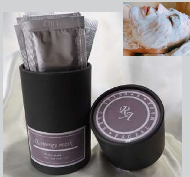
RA O 2 エナジーマスク 1箱10回分(袋) 7,020円(税込)