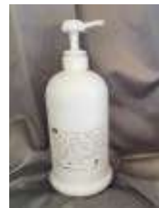
業務用マッサージジェル (1*) 15,000円 (税抜)