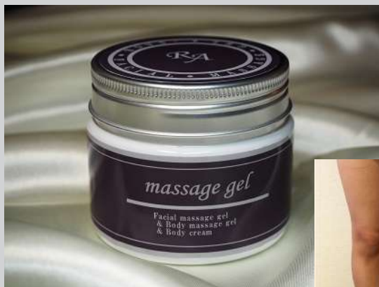
RAフェイスマッサージジェル—5AGE